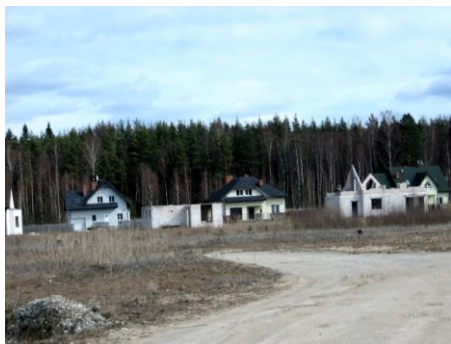
5.4. att. Pļavu ciems Ādažos

2008: 11). Visi pētījumā iesaistītie vietējie politiķi uzsvēra, ka vietējā pašvara patiesībā bijusi bezspēcīga vadīt jaunās apbūves procesus Pierīgā, jo dienaskārtību noteica zemes īpašnieki un viņus lobējošie vietējo domju deputāti.