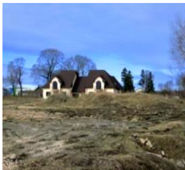
5.5. att. Ainavas degradācija

5.4. un 5.5. attēli liecina, ka māju būvniecība notikusi bijušajās lauksaimniecības un meža teritorijās un, būvniecībai apstājoties, ainava nav ieguvusi apdzīvotai vietai raksturīgus elementus, bet dabas ainavas ir iznīcinātas. Daļa jauno savrupmāju ir nepabeigtas celtniecības stadijā, jo projekta attīstītājs, iespējams, ir bankrotējis.