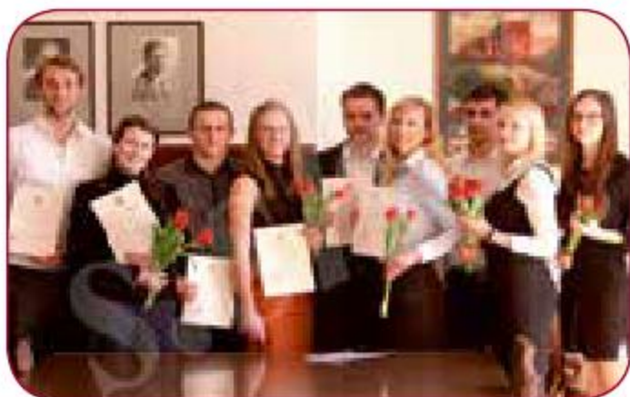
LSPA Studentu zinātniskajā konferencē un pētniecības aparatūras izstādē In LASE student scientific conference and exhibition of research equipment