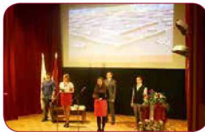
LSPA Patriotu svētkos LASE Patriot celebration