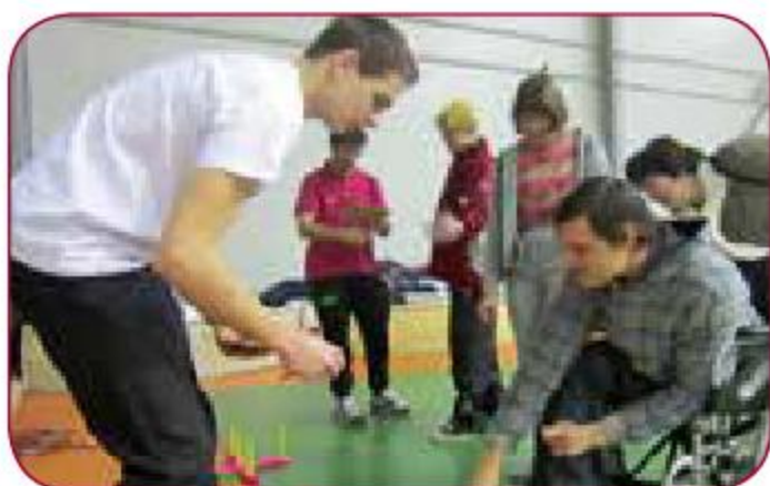
Sporta pasākumos bērniem ar īpašām vajadzībām In sport activities for children with special needs