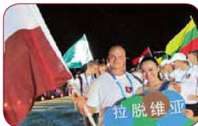
Pasaules Universiādē In the World Universiade