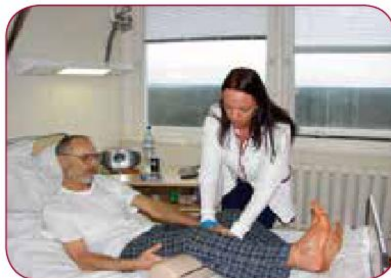
Topošo fizioterapeitu studiju process / Study process of future physiotherapists