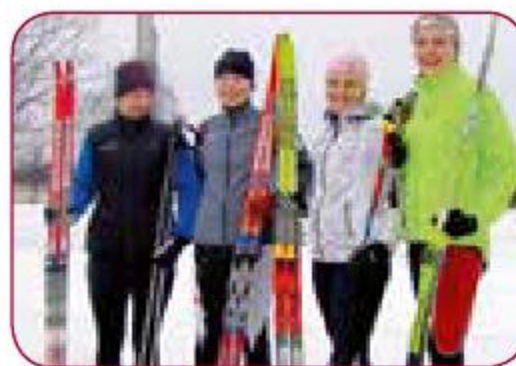
LSPA slēpošanas izlase/LASE skiing team Gada labākā komanda individuālajos sporta veidos Best LASE team in individual sports of the year