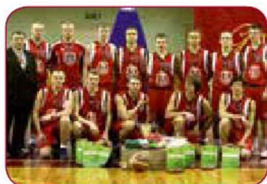
LSPA vīriešu basketbola komanda LASE men basketball team Gada labākā vīriešu sporta spēļu komanda Best men sport game team of the year