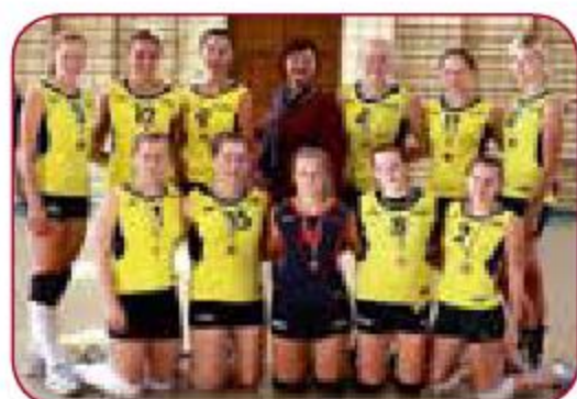
LSPA sieviešu volejbola komanda LASE women volleyball team Gada labākā sieviešu sporta spēļu komanda Best women sport game team of the year