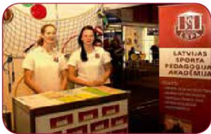
Starptautiskajā izglītības izstādē „Skola-2012” In the International education fair „School-2012”