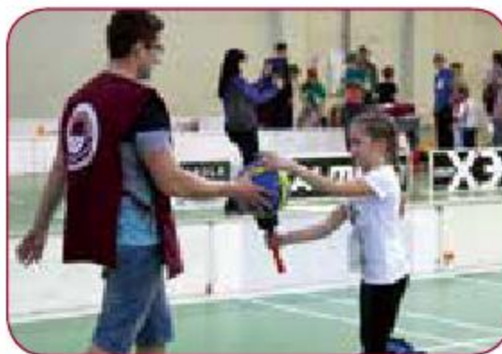
Nacionālo kultūras biedrību bērnu sporta svētki Latvian National Culture Societies Children's Sports Festival