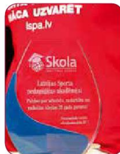
Starptautiskā izglītības izstāde „Skola-2014” International Education Fair “School 2014”