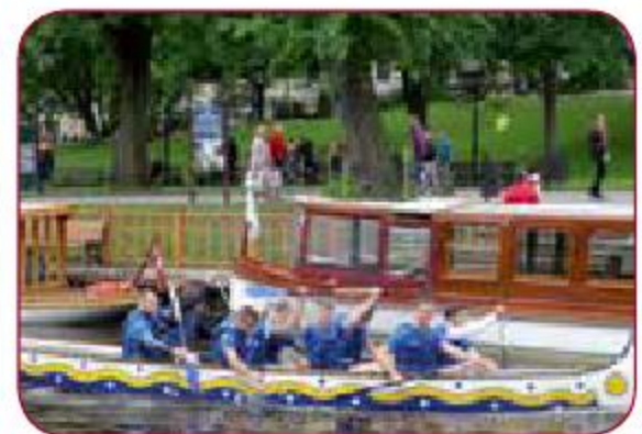
Rīgas Sporta nakts Riga Sports Night