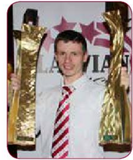
Mūsējo uzvara Latvijas XXIV Universiādes kopvērtējumā Our victory in XXIV Latvian Universiade standings