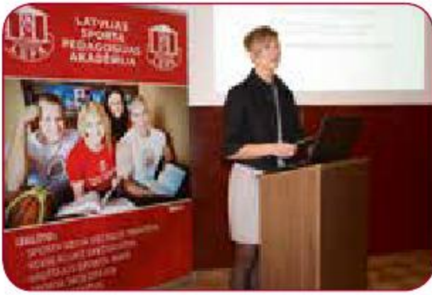
LSPA Studentu zinātniskā konference LASE student scientific conference