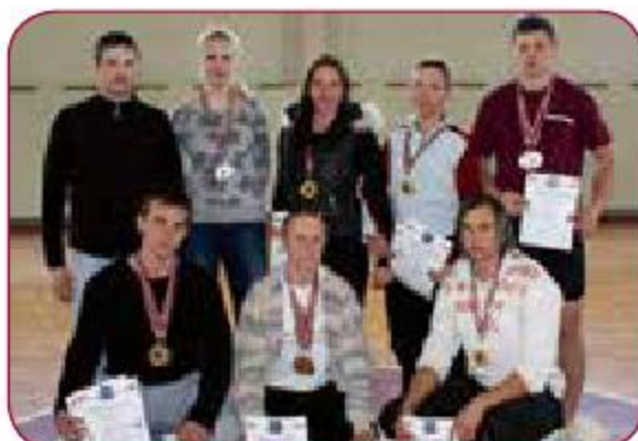
LSPA svarbumbu sporta komanda LASE kettlebell sports team Gada labākā komanda individuālajos sporta veidos Best LASE team in individual sports of the year