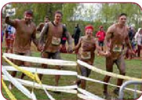
Stipro skrējiens-2014 Strongmen Run 2014