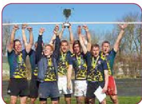
LSPA vīriešu regbija komanda LASE men rugby team Gada labākā vīriešu sporta spēļu komanda Best men sport game team of the year