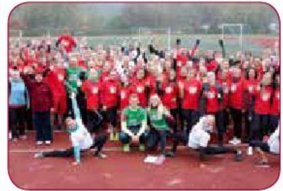
Olimpiskā diena-2014/Olympic Day-2014