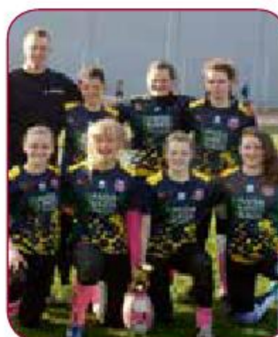
LSPA sievietes regbija komanda LASE women rugby team Gada labākā sievietes sporta spēļu komanda Best women sport game team of the year