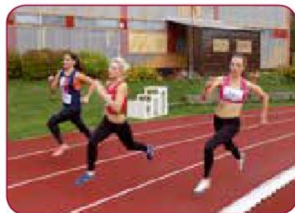
Sporta sacensības dažādos sporta veidos / Sports competitions in different sports