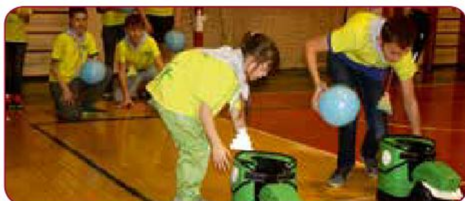
Sporta pasākumi un aktivitātes bērniem / Sports events and activities for children