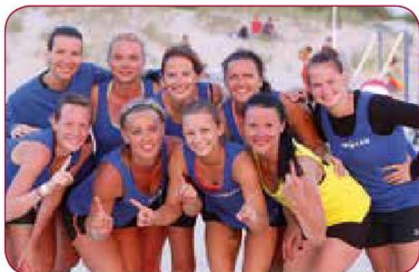
Gada labākā sieviešu sporta spēļu komanda Best women sport game team of the year LSPA sieviešu handbola komanda LASE women handball team