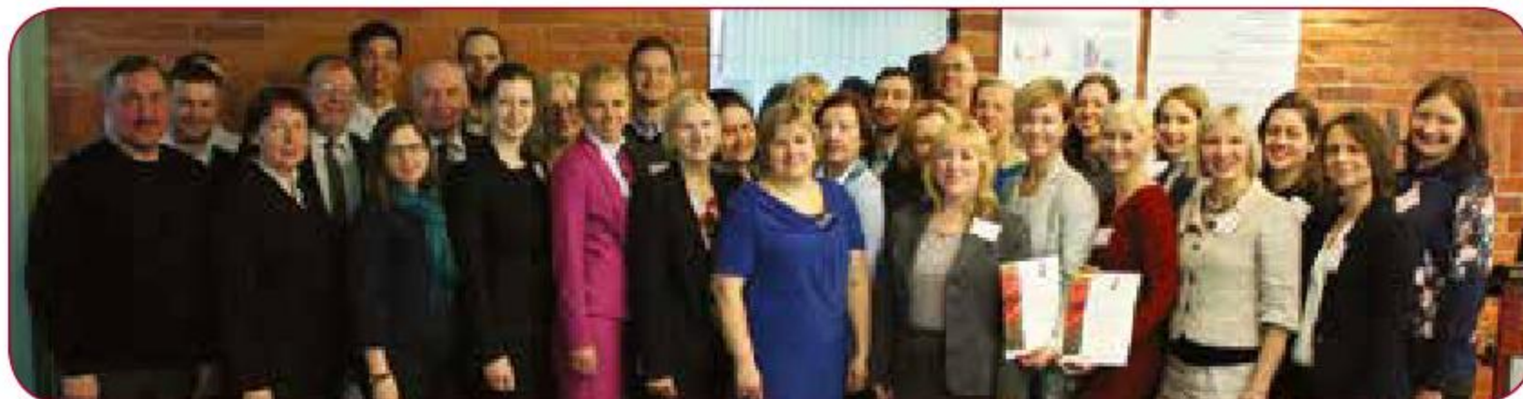
LSPA docētāji un studējošie-konferences dalībnieki/LASE academic staff and students-Conference participants