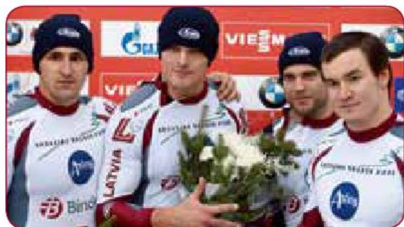
Gada labākā komanda individuālajos sporta veidos Best LASE team in individual sports of the year LSPA bobsleja komanda LASE bobsleigh team