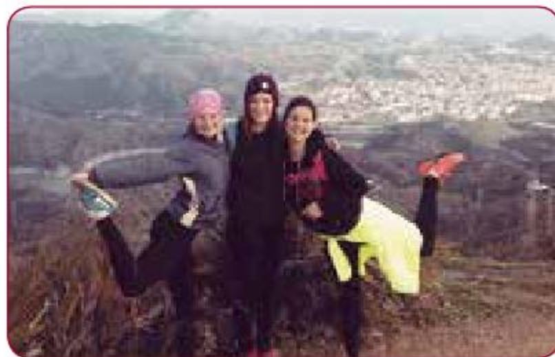
LSPA studentu mobilitāte Malagas Universitātē / LASE student mobility in Malaga University

In 2015 LASE signed ERASMUS+ cooperation inter-institutional agreements with 37 universities from Belgium, Bulgaria, Czech Republic, Denmark, Croatia, Estonia, Italy, Lithuania, Norway, Poland, Portugal, Romania, Slovakia, Spain, Finland, Turkey, Hungary and Germany, as well as we cooperate in the framework of ERASMUS+ program with partner universities in Belarus and Ukraine: the Belarusian State University of Physical Culture and the Ukrainian National Physical Education and Sports University.