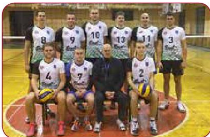
Gada labākā vīriešu sporta spēļu komanda Best men sport game team of the year LSPA vīriešu volejbola komanda LASE men volleyball team