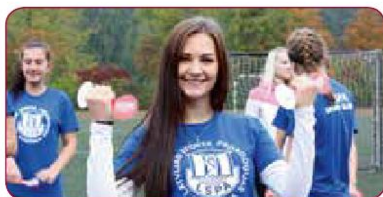
Olimpiskā diena-2015/Olympic Day-2015