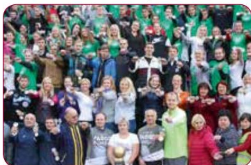
Olimpiskā diena-2016/Olympic Day-2016