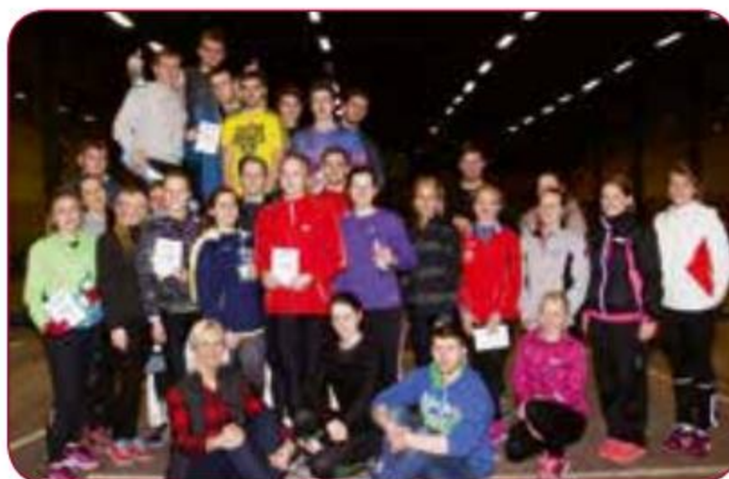
Gada labākā komanda individuālajos sporta veidos/ Best LASE team in individual sports of the year LSPA vieglatlētikas komanda/ LASE Track and Field team