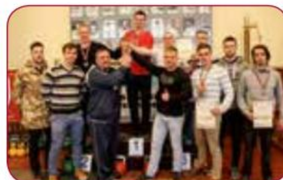
Sporta sacensības dažādos sporta veidos / Sports competitions in different sports