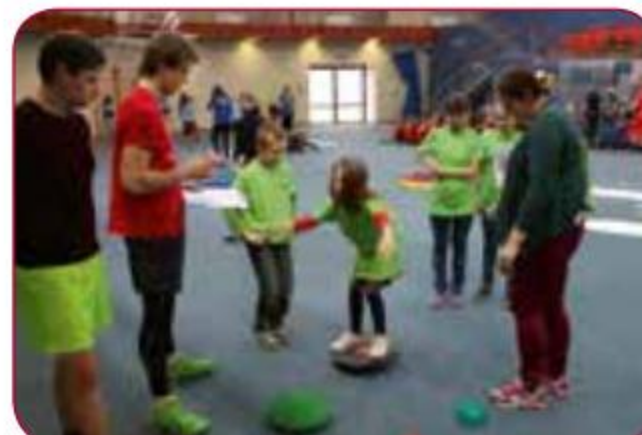
LSPA studenti brīvprātīgo darbā sporta pasākumos un fiziskajās aktivitātēs bērniem Volunteer work, sports events and exercise for children