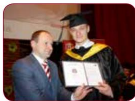
Mārtiņš PĻAVIŅŠ pludmales volejbols/beach volleyball vairākkārtējs Eiropas un Pasaules čempionātu godalgoto vietu ieguvējs, bronzas medaļas ieguvējs 2012.gada Londonas Olimpiskajās spēlēs/ A frequentative prize winner of European and World championships, bronze medal winner of the London 2012 Olympic Games