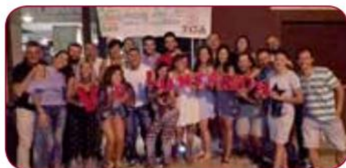
LSPA studentu mobilitāte Malagas Universitātē (Spānija) un Zagrebas Universitātē (Horvātija) LASE student mobility in Malaga University (Spain) and Zagreb University (Croatia)

In 2016, LASE has signed ERASMUS+ cooperation inter-institutional agreements with 38 universities from Belgium, Bulgaria, Czech Republic, Denmark, Croatia, Estonia, Italy, Lithuania, Norway, Poland, Portugal, Romania, Slovakia, Spain, Finland, Turkey, Hungary and Germany. Since 2015 we cooperate within the framework of ERASMUS+ programme with partner universities in Belarus, Ukraine and Israel: the Belarusian State University of Physical Culture, the Ukrainian National Physical Education and Sports University and the Zinman College for Physical Education and Sport Sciences at the Wingate Institute.