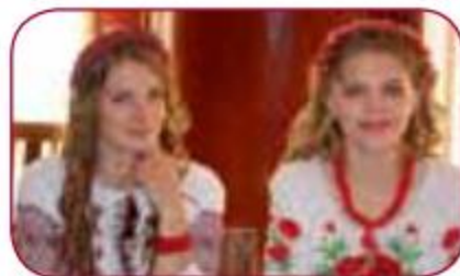
Ārzemju studentu mobilitāte LSPA/ Foreign student mobility at LASE