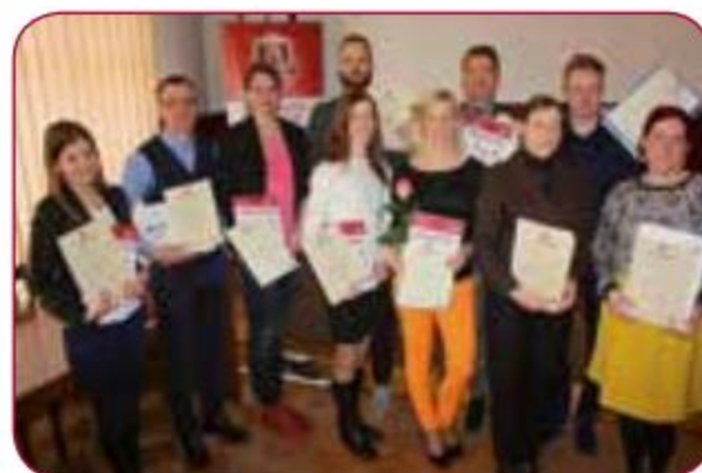
Konferences uzvarētāji/ Winners of the Conference

The 8th International Scientific Conference of Doctoral and Master Students of LASE „Sport Science for Modern Society” was attended by 46 participants from Ukraine, India and Latvia, which presented 23 reports and 23 posters. The Conference participant presentations were watched by potential employers who are interested in the future sports specialist practical study skills, ability to use scientific research achievements and benefits.