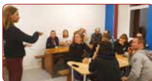
Teorētiskās nodarbības/ Theoretical lessons