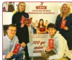
Erasmus dienas LSPA / Erasmus Days at LASE

In 2020, for the first time, LASE participated in Erasmus Day activities organized by the International Relations Centre in cooperation with the State Education Development Agency to invite students to share experiences, as well as to encourage and explain to students the benefits of mobility in Erasmus+ programmes.