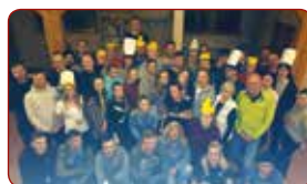
Ziemas nometne/Winter camp

LSPA akreditētās studiju programmas tiek īstenotas 8 KATEDRĀS / LASE accredited study programmes are implemented in 8 DEPARTMENTS: