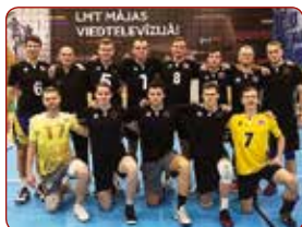
LSPA/Stopini vīriešu volejbola komanda / LASE/Stopini men's volleyball team

Gada labākās sporta spēļu komandas / Best sport game teams of the year