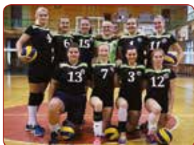
LSPA sievietes volejbola komanda / LASE women's volleyball team

Gada labākā komanda individuālajos sporta veidos Best team of the Year in individual sports