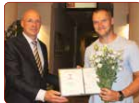
Eiropas čempions, pasaules kausa posmu uzvarētājs bobslejists Matiss MIKNIS / bobsleigher, European Champion, world cup stage winner