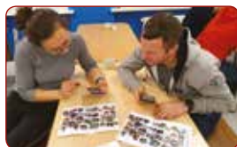
Praktiskās nodarbības/ Practical lessons