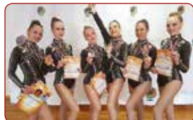
LSPA mākslas vingrošanas izlase LASE Picked Team of Art Gymnastics

Gada labākā komanda individuālajos sporta veidos Best team of the Year in individual sports