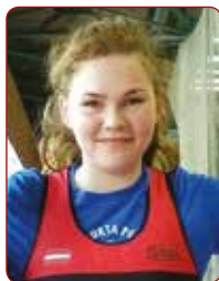
Juta GARGURNE klasiskā spēka tričīņa / classic power triathlon