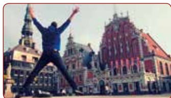
Students no Čehijas ekskursijas laikā Vecrigā / Student from the Czech Republic during a tour of Old Riga

Koimbras Universitātes (Portugāle) studenti Latvijā / Students of the University of Coimbra (Portugal) in Latvia