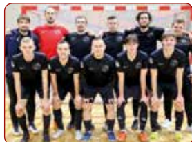
LSPA vīriešu futbola komanda / LASE men's football team

Gada labākās sporta spēļu komandas / Best sport game teams of the year