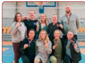
LSPA sievietes basketbola komanda / LASE women's basketball team

Gada labākā izlases komanda individuālajos sporta veidos / Best Selection Team of the Year in Individual Sports