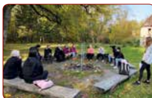
Studenti praktiskajās nodarbībās / Students During Practical Classes