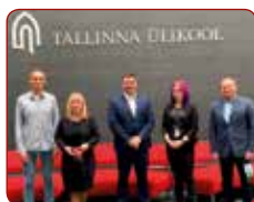
Tallinas Universitātē / At Tallinn University