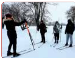
Slēpošanas nodarbībā / In ski lesson