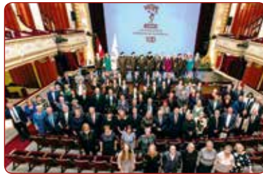
LSPA simtgades svinīgā Senāta sēde 2021.gada 6.septembrī Latvijas Nacionālajā teātrī Solemn Senate sitting dedicated to the centenary of LASE at the Latvian National Theatre on September 6, 2021

In its path of operation and growth, the only higher education institution in Latvia in the field of sports has gone through a 100-year path of development. Already in 1920, a project was developed for the establishment of the Latvian Central Institute of Pedagogical Physical Education, the statutes were approved, and six months later the opening ceremony took place at the National Theatre. Meanwhile, on September 6, 1921, a solemn event for the founding of the higher education institution, then called the Latvian Institute of Physical Education , was held in the Great Hall of the National Theatre, which is still considered to be the founding date of our Latvian Academy of Sport Education (LASE). According to the conditions of each specific time period, political power and other circumstances, LASE has always relied on the objectives set in the first regulatory documents 100 years ago: the need to balance mental and physical development, as well as to develop physical activity without risks to health . Undoubtedly, the goals and tasks of the Academy during each period of its operation were set in accordance with the above-mentioned circumstances; however, the smart words formulated in the operational objective at the very beginning are still very relevant today.