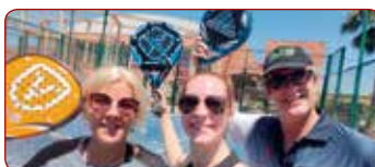
Malagas Universitātes Sporta centrā / At the Sports Center of the University of Malaga