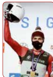
Roberts PLŪME kamaniņu sports / luge

Gada sportisti komandu sporta veidos Athletes of the Year in team sports