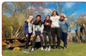
Pārgājiena iepazīst Valmieru un tās apkārtni / Getting to know Valmiera and its surroundings during a hike