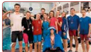
LSPA peldēšanas izlase LASE Swimming Picked Team

Gada labākā izlases komanda individuālajos sporta veidos / Best Selection Team of the Year in Individual Sports