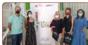
Malagas Universitātes Starptautiskajā centrā / At the International Center of the University of Malaga