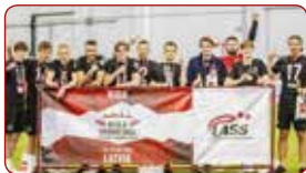
LSPA vīriešu futbola komanda / LASE men's football team

Gada labākās sporta spēļu komandas / Best sport game teams of the year