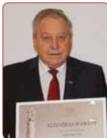
Profesoram Uldim GRĀVĪTIM

par nozīmīgu ieguldījumu augstākās izglītības, zinātnes un sporta attīstībā piešķirts / for a significant contribution to the development of higher education, science and sport was awarded to