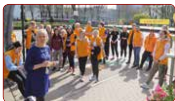
Kvalifikācijas eksāmena praktiskā daļa / Practical Part of the Qualification Exam