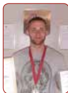
Roberts PLŪME kamaniņu sports