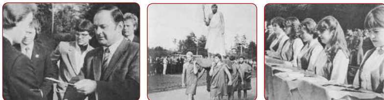
1.Hērakla svētki 1982.gadā / 1st Hercules celebration in 1982