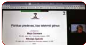
Konferences dalībnieku prezentācija / Presentation of Conference Participants

# Medicīniskie, bioloģiskie un biomehāniskie aspekti sportā un veselībā / Medical, Biological and Biomechanical aspects in Sport and Health (6 referāti/11 dalībnieki)