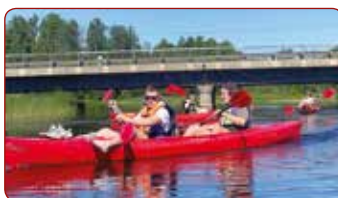
Praktiskās nodarbes ūdens tūrismā / Practical Classes in Water Tourism