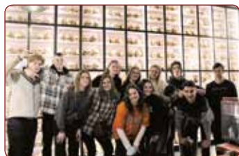
Anatomijas apgūšana / Acquiring Anatomy