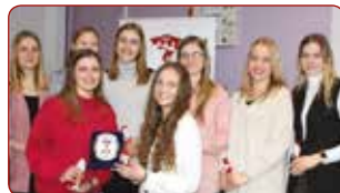
LSPA sieviešu vieglatlētikas izlase LASE Picked Team of Track and Field

Gada labākā komanda individuālajos sporta veidos Best team of the Year in individual sports