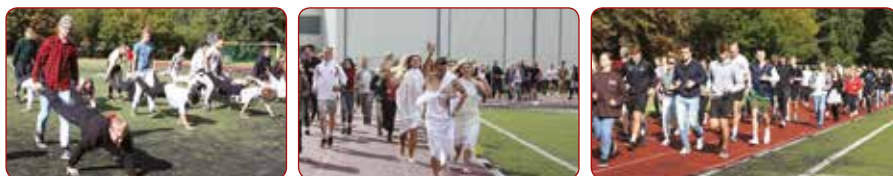
40.Hērakla svētki 2022.gadā / 40th Hercules celebration in 2022