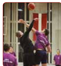
Ieskaites sacensības basketbolā / Scoring competition in basketball