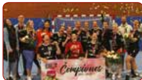
LSPA sieviešu handbola komanda / LASE women's handball team

Gada labākā komanda individuālajos sporta veidos Best team of the Year in individual sports